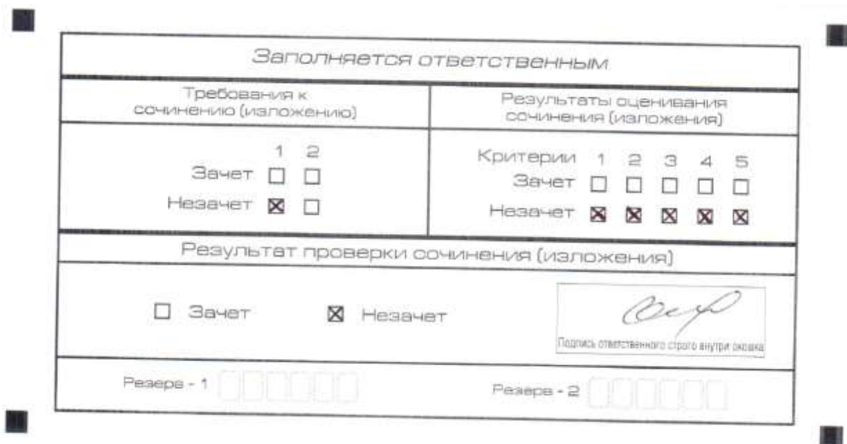
Рис. 5. Область для оценки работы

Эксперт комиссии (ответственное лицо) выставляет «незачет» за невыполнение требования № 2. В клетки по всем пяти критериям оценивания выставляется «незачет». В поле «Результат проверки сочинения (изложения) ставится «незачет».