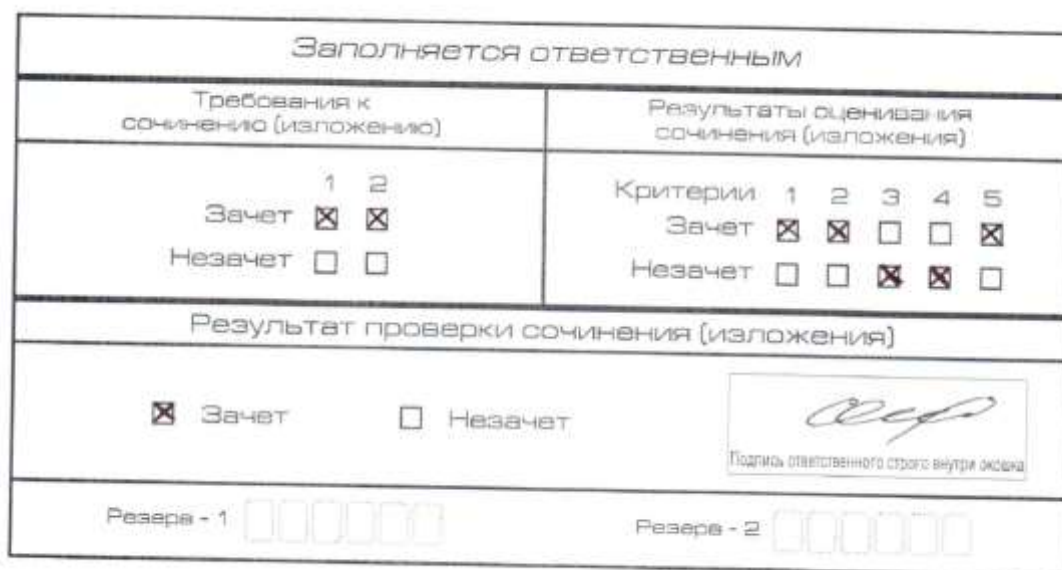
Рис. 6. Область для оценки работы

После окончания заполнения бланка регистрации ответственное лицо ставит свою подпись в специально отведенном для этого поле.